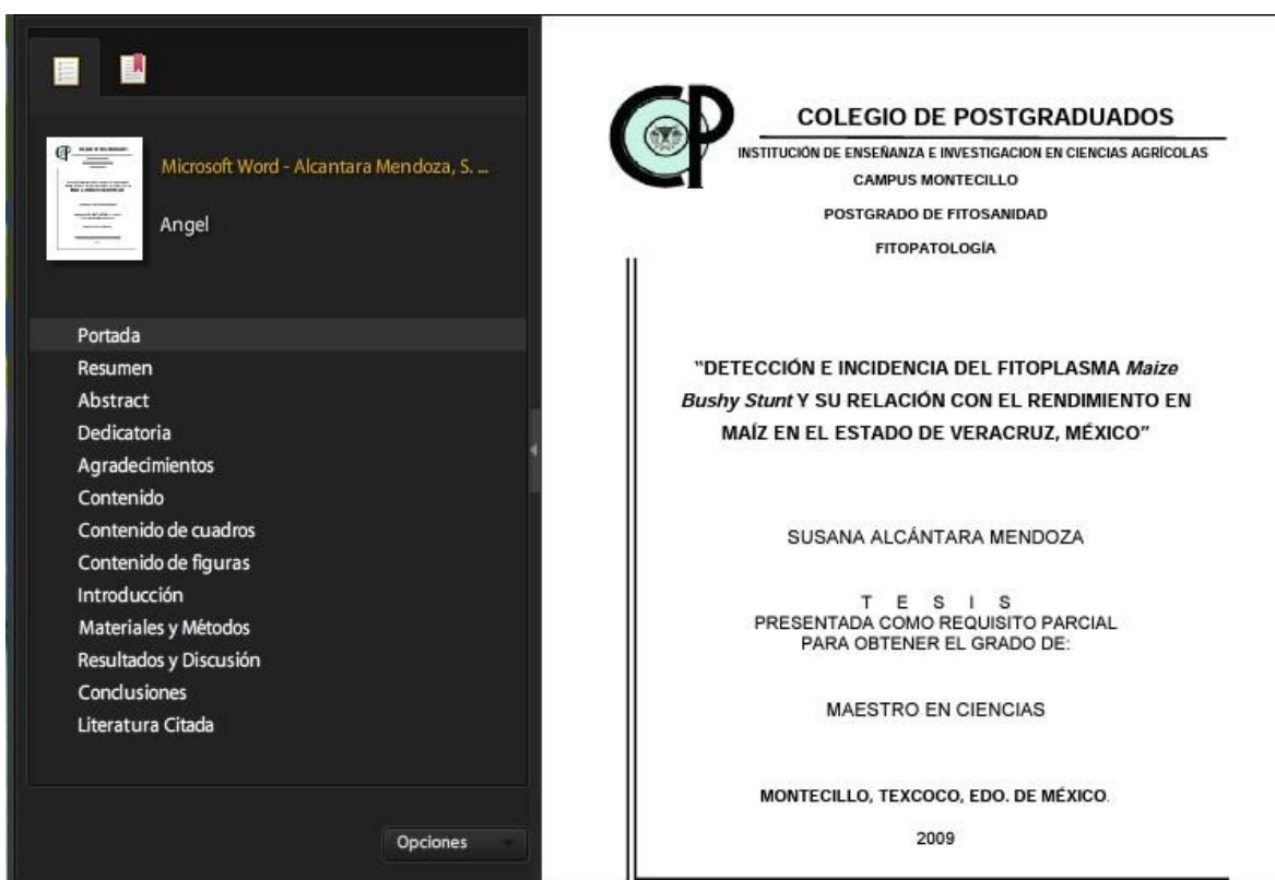
Figura 5. Marcadores de las partes principales de una tesis.

Se deberán entregar dos CDs o DVDs conteniendo en uno de ellos los archivos en los dos formatos antes citados, en otro sólo en formato PDF.