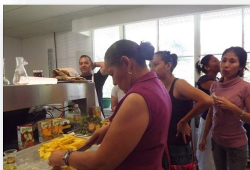
“ELABORACIÓN DE YOGURT”, CAMPUS TABASCO.

En el año 2013, periodo que comprende el presente informe, los Campus del Colegio de Postgraduados impartieron un número de cursos de capacitación sobre diversos temas estratégicos de particular aplicación e interés para los productores y organizaciones involucradas. En el cuadro a continuación se enlista la temática de capacitación que se impartió.