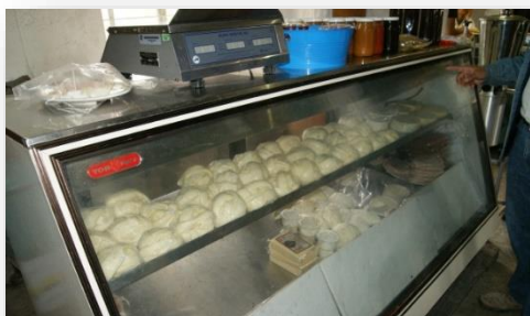
VENTA DE PRODUCTOS EN TRASPATIO