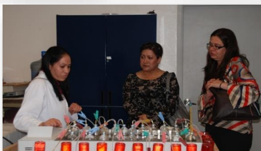
SERVICIOS DE LABORATORIOS