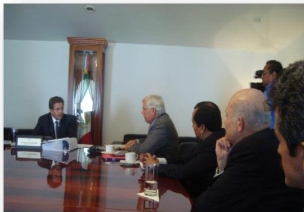
PARTICIPACIÓN CON GOBIERNO ESTATAL, CAMPUS SLP.