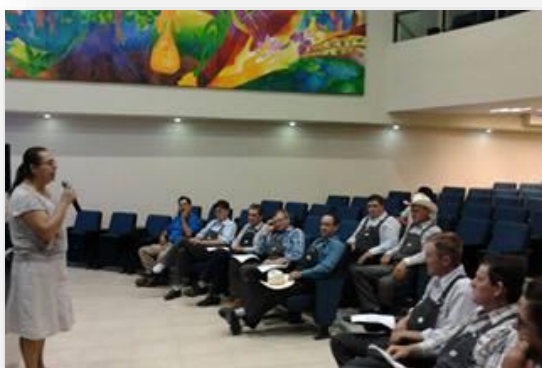
CURSO CON PRODUCTORES MENONITAS, CAMPUS VERACRUZ.

Durante el 2013, se suscribieron 14 convenios con instituciones nacionales e internacionales para la capacitación de personal profesional por un monto convenido de poco más de 4.72 millones de pesos.