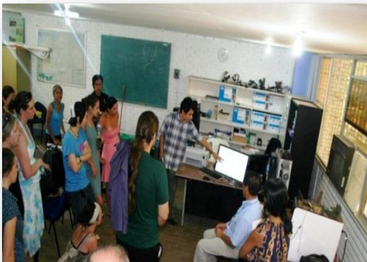
VISITA DE ALUMNOS CANADIENSES EN CAMPUS TABASCO.

Adicionalmente a lo anterior, debe destacarse también la labor de transferencia tecnológica que se desarrolla al interior de los propios campus, organizando días de campo, atendiendo grupos y organizaciones de productores (Cuadro 18) y atendiendo visitas de interesados en diversos temas agropecuarios, así como en la organización de pláticas, simposios, congresos y seminarios.