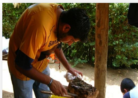
“CRIANZA DE ABEJA SIN AGUIJÓN”, CAMPUS CORDOBA