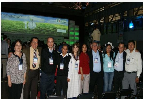
PARTICIPACIÓN DE ACADÉMICOS EN EL 10º FORO GLOBAL AGROALIMENTARIO

El Consejo Nacional Agropecuario constituye el organismo cúpula empresarial del sector agropecuario mexicano. Al representar los intereses, las demandas y las preocupaciones del sector privado en materia agrícola y pecuaria, el Colegio de Postgraduados ha mantenido estrecho contacto con esta organización. De esta manera el COLPOS participa anualmente en la versión anual del Foro Global Agroalimentario a través de la asistencia de un nutrido grupo de académicos, la instalación de un stand institucional y otras actividades. En el 2013 se llevó a cabo la 10ª versión de tan importante evento, del 3 al 5 de octubre en la ciudad de Aguascalientes.