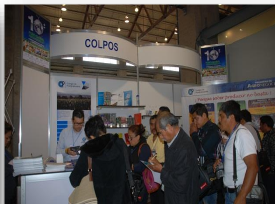
STAND INSTITUCIONAL, AGUASCALIENTES 2013