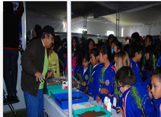
SEMANA DE LA CIENCIA Y LA TECNOLOGÍA, CAMPUS MONTECILLO