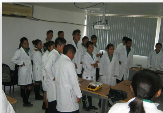
CURSO A ESTUDIANTES DE CECYTEC CAMPECHE.