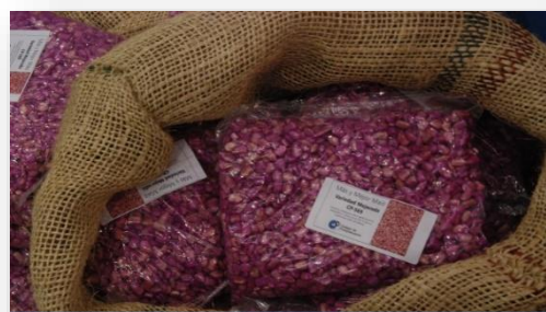
VARIEDAD DE MAIZ MEJORADA CP-569