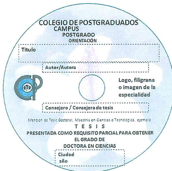
Figura 4. Disco con etiqueta impresa con fondo alusivo al tema de la tesis.

Preferentemente el formato se debe imprimir sobre fondo claro, pero se aceptan discos con imagen alusiva al tema de la tesis, siempre y cuando no interfiera con la visibilidad de los datos impresos (Figura 4.)