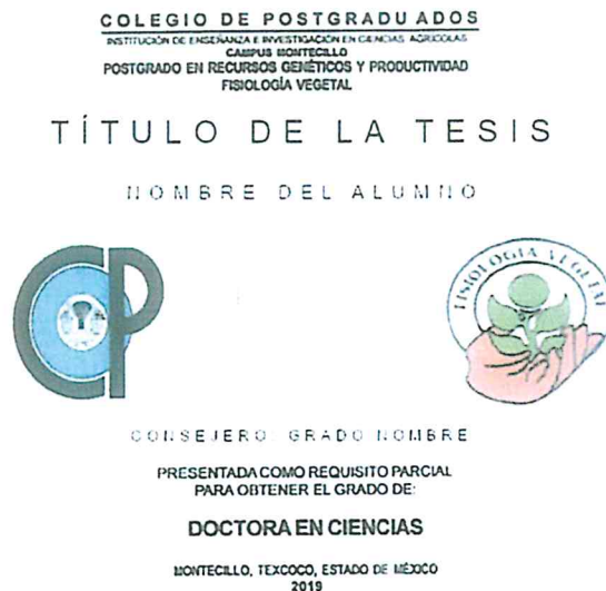
Figura 2. Disco impreso con caratula impresa directamente.

Los discos que se piden son especiales para su impresión con cara blanca, que llevará la portada; para su impresión en inyección de tinta u otro dispositivo similar y que no se borre su contenido. La impresión debe de realizarse de manera limpia o se puede permitir una imagen de fondo, siempre y cuando no altere los datos impresos que lleva el disco (Figura 2).