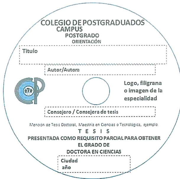
Figura 3. Formato con los datos de la impresión que debe llevar el disco.

Preferentemente el formato se debe imprimir sobre fondo claro, pero se aceptan discos con imagen alusiva al tema de la tesis, siempre y cuando no interfiera con la visibilidad de los datos impresos (Figura 4.)