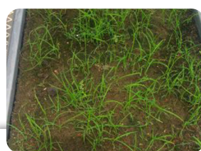
Figura 3. Germinación del fuzz