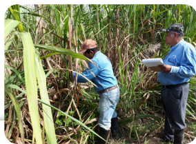
Figura 5. Evaluación de híbridos y clones