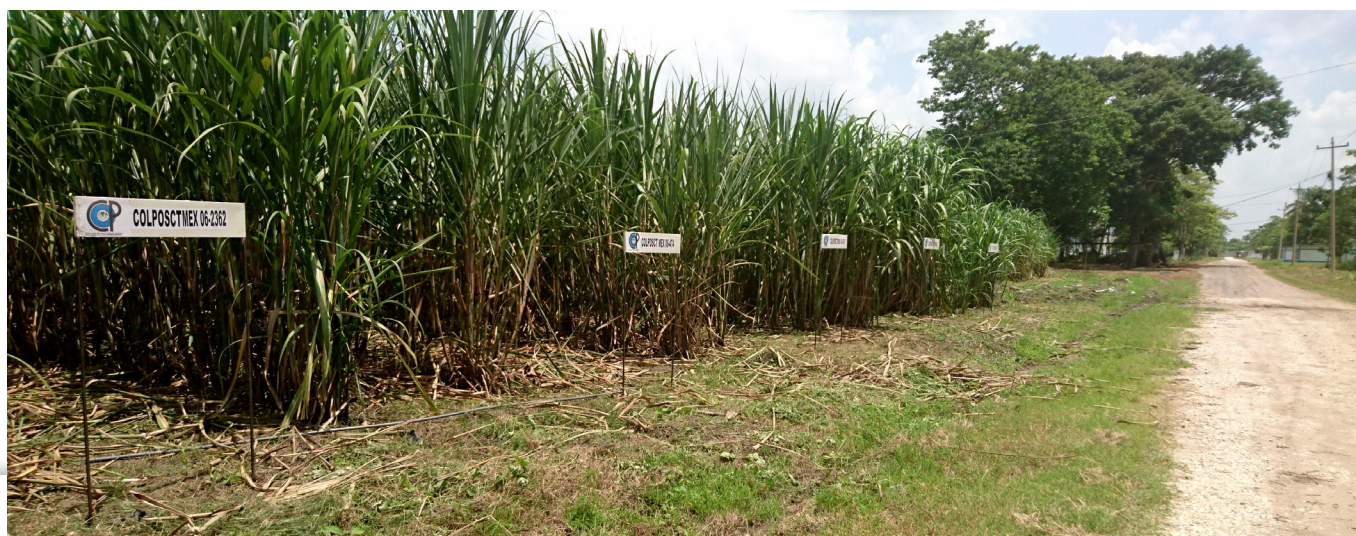
Figura 9. Variedades prometedoras seleccionadas en el Campus Tabasco del Colegio de Postgraduados