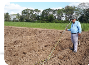
Figura 8. Multiplicación de híbridos clones seleccionados