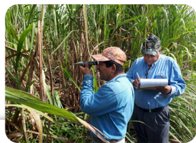
Figura 6. Evaluación de híbridos y clones