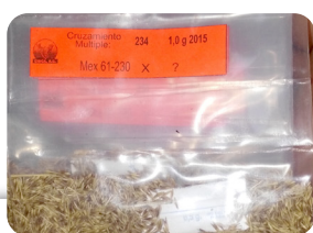
Figura 1. Semilla botánica de caña de azúcar (fuzz)

Después de 14 años de selección de variedades de caña de azúcar, se obtuvieron siete: COLPOSCTMEX 05-204, COLPOSCTMEX 05-223, COLPOSCTMEX 06-039, COLPOSCTMEX 06-474, COLPOSCTMEX 06-2362, COLPOSCTMEX 07-1320 y COLPOSCTMEX 08-1270, con características botánicas, agronómicas, fitosanitarias, e industriales superiores a las cultivadas. Las nuevas variedades benefician a productores, industria, y a la sociedad al crear empleos directos e indirectos.