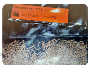
Figura 2. Fuzz