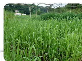
Figura 4. Desarrollo de los híbridos de caña de azúcar