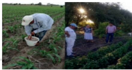
Figura 2. Mejoramiento del Maíz y Frijol.