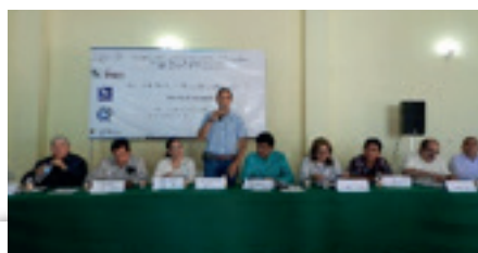
Figura 5. Apoyo a la coordinación interinstitucional.