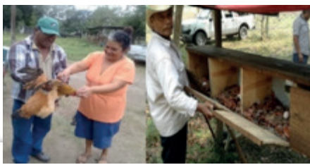
Figura 1. Ordenamiento y mejora del Traspatio o Solar.

Como resultados, se promocionaron semillas mejoradas y se generó una recomendación técnica para maíz, se generaron prototipos para el mejoramiento del solar y el manejo de aves, cerdos y ovinos con mínimos recursos materiales y mano de obra familiar, se promovió la educación financiera y se impulsó el empoderamiento comunitario y de las mujeres, las actividades de vinculación con instituciones de investigación permitieron desarrollar experiencia en el ámbito académico fortaleciendo los cursos e investigación relacionada con la agricultura familiar, así como el establecimiento de los principios y lineamientos propuestos sobre el Extensionismo rural.