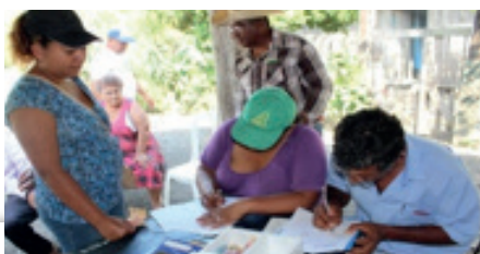
Figura 4. Grupos de Ahorro solidario y préstamo comunitario.