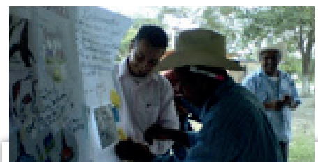
Figura 6. Diagnostico rural participativo.