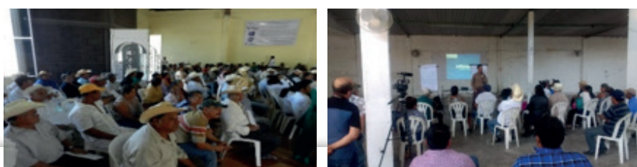
Figura 7. Presentación pública de 4 Informes anuales de resultados e Intercambio de saberes.