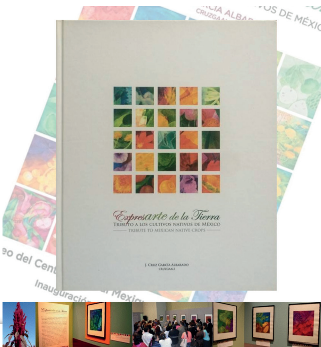
Figura 1. Libro Expresarte de la Tierra.

Como resultado, estas obras resaltan la importancia de las plantas mexicanas y su vinculación con la alimentación y bienestar, la historia y la cultura.