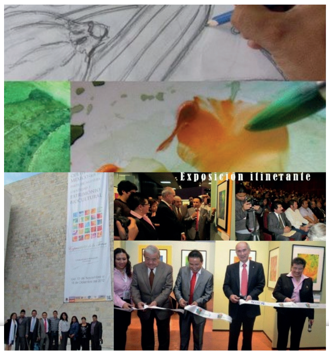
Figura 2. Exposición pictórica.