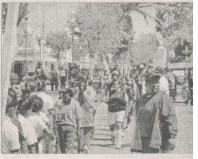
De la Redacción